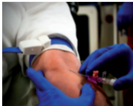
Handschuhe nur dann tragen, wenn es nötig ist. Z. B. nicht beim Öffnen von Türen.

Damit dürften einige Diskussionen endgültig erledigt sein. Und Eheringe sind eben auch Ringe. Heute braucht kein Rettungs-