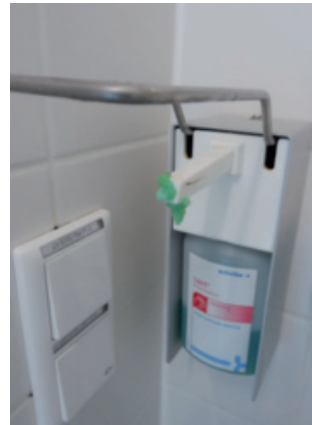
Auch Waschlotionsspender benötigen...