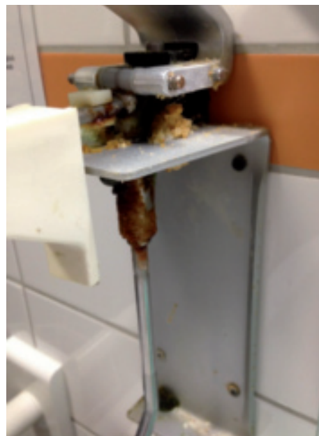
...regelmäßig eine Pflege/Reinigung.

Die Spender brauchen auch etwas Pflege! Werden Händedesinfektionsmittel mit einem hohen Anteil von Sorbitol (s. o.) verwendet, neigt das dazu, auszukristallisieren. Waschlotionsspender erwarten bei jeder Neubestückung eine Innenreinigung, wie auch das RKI in seiner Richtlinie für Händehygiene 28 angibt. Ansonsten bleiben Reste, die auch schimmeln können.