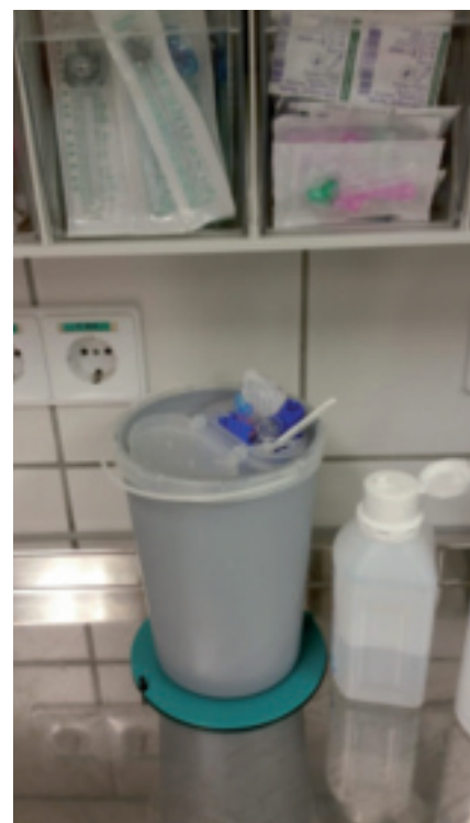
Benutze Handschuhe gehören nicht in die Kanülenabwurfbox.

beim Autofahren nicht auszieht, hat etwas nicht begriffen.